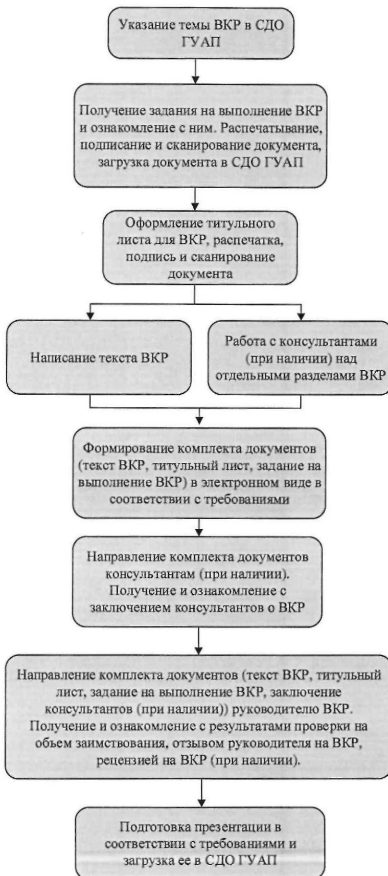
Схема 1. Последовательность действий для студента