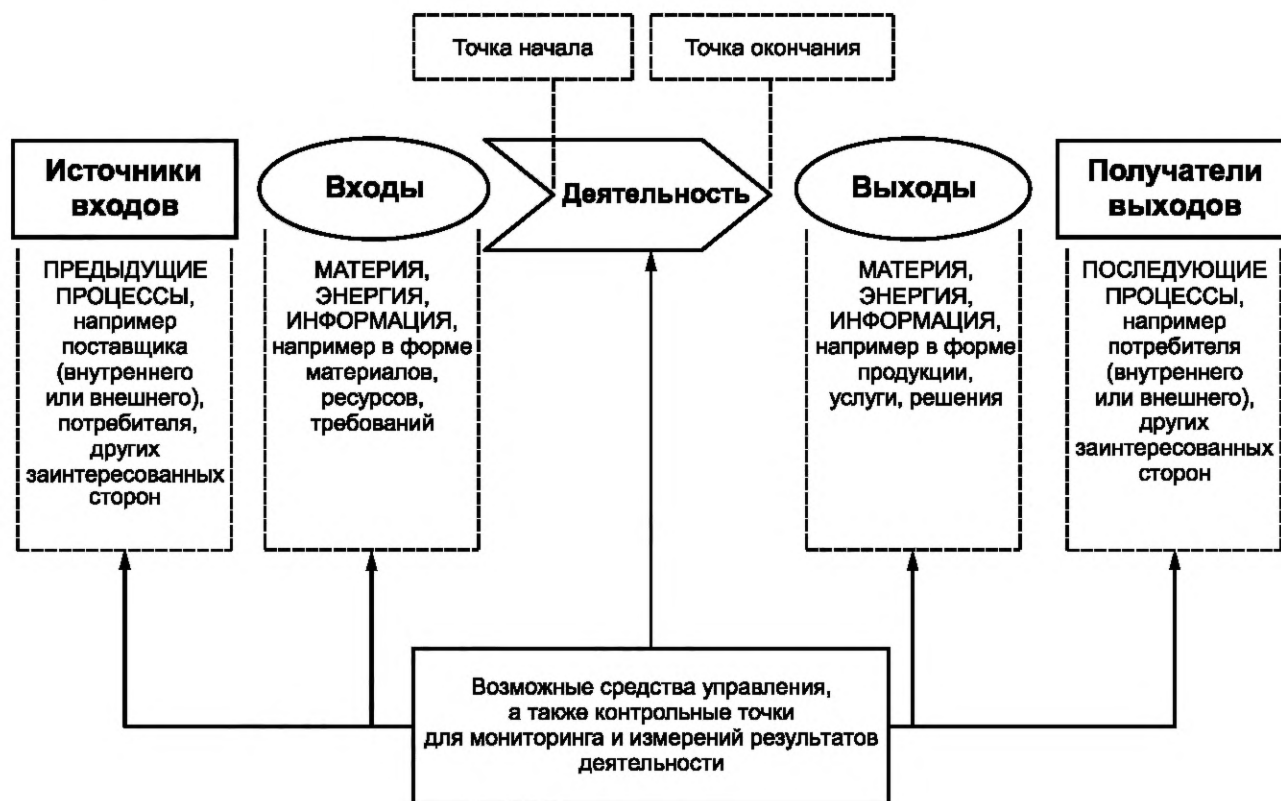
Рисунок 1 — Схематичное изображение элементов процесса

На рисунке 1 приведено схематичное изображение любого процесса и проиллюстрирована взаимосвязь элементов процесса. Контрольные точки мониторинга и измерения, необходимые для управления, являются специфическими для каждого процесса и будут варьироваться в зависимости от соответствующих рисков.