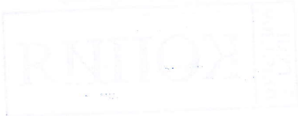
Таблица № 1